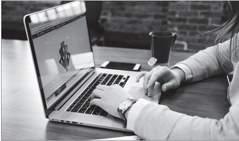
Обучение студентов работе с технологиями ИИ

На основании данных можно сделать вывод, что использование ИИ эффективно как инструмент для повышения интереса студентов к учебной дисциплине и создания более комфортной образовательной среды. Однако для оценки долгосрочных эффектов применения ИИ необходимы дальнейшие исследования.